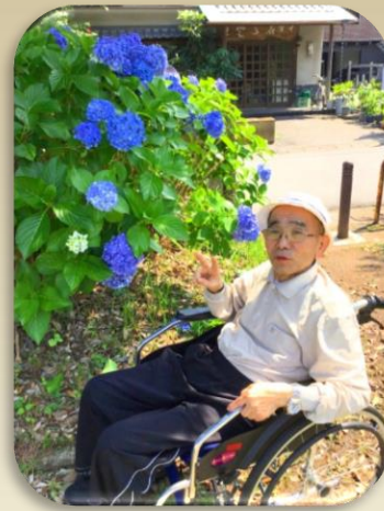
散歩が楽しめる環境