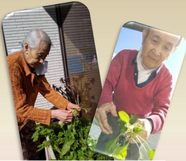
家庭菜園・新鮮野菜