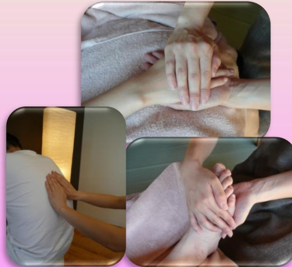
タクティールケア 認知症状の緩和・心地良さ