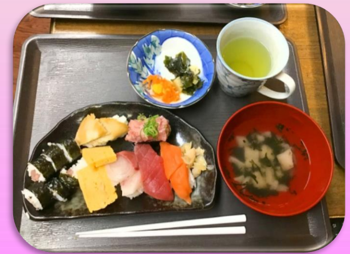
出来立てのお食事